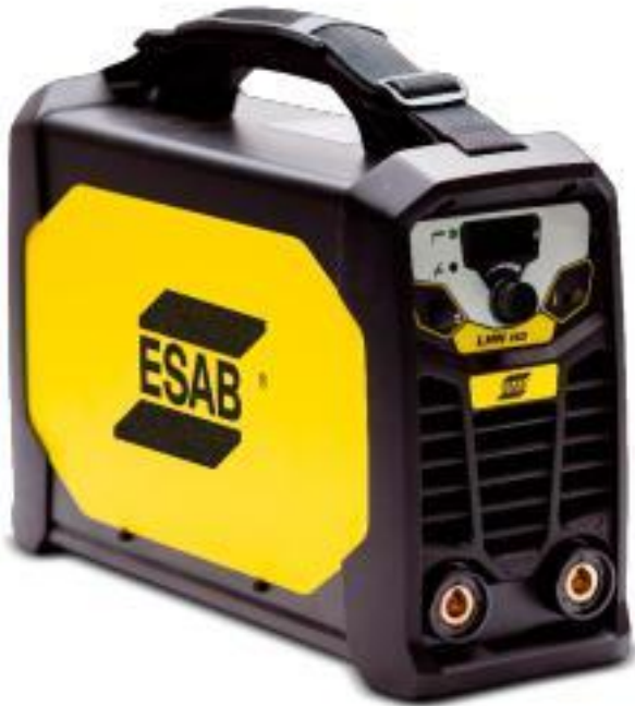
ROGUE LHN 242i

No se conforme con tener lo básico, elija ROGUE LHN.